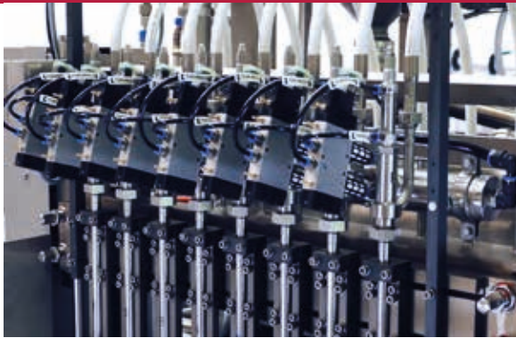
Дозатор для жидких и пастообразных продуктов