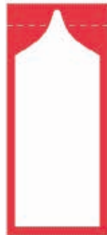
Contour en forme de col de bouteille