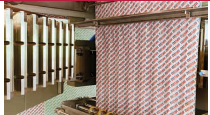
Scellage des sachets